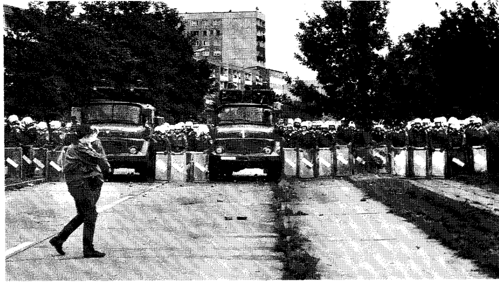
29 septembre - Des manifestants antifascistes se rassemblent à Hoyerswerda, rejoints par des habitants de la ville. La police attaque les manifestants avec des canons à eau.