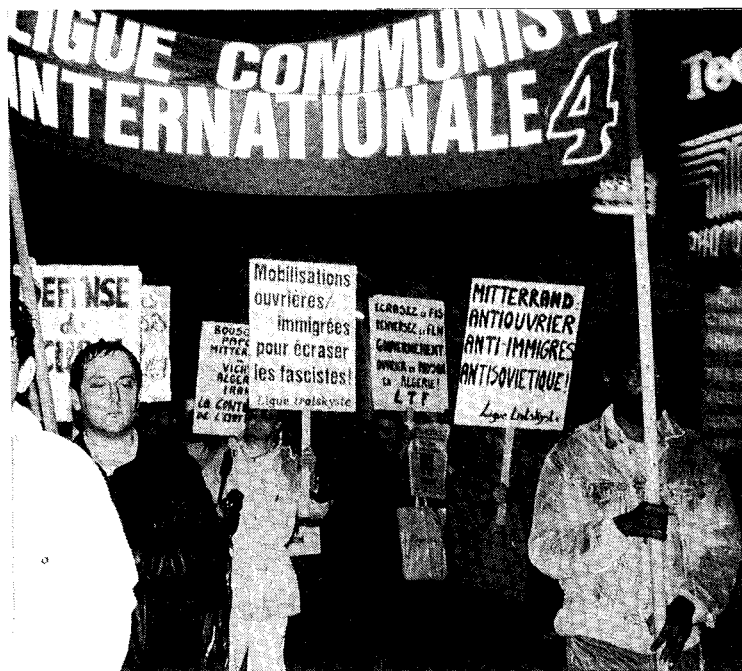
Le cortège de la Ligue trotskyste lors de la manifestation en hommage aux victimes du 17 octobre 1961.

L'Humanité consacre le lendemain, tout comme les jours suivants, le titre principal de sa première page au... XXII e congrès du PC soviétique ! Son article sur les événements du 17 octobre qui, s'il n'est pas précis sur l'ampleur de la répression (mais comment aurait-il pu l'être ! – le PCF était criminellement absent de la manifestation !), décrit la bestialité policière. Néanmoins, le titre qui annonce l'article dit de façon scandaleusement neutre : « Plus de 20 000 Algériens ont manifesté dans Paris », et seulement en-dessous, en tout petits caractères : « Combien de morts ? Deux,