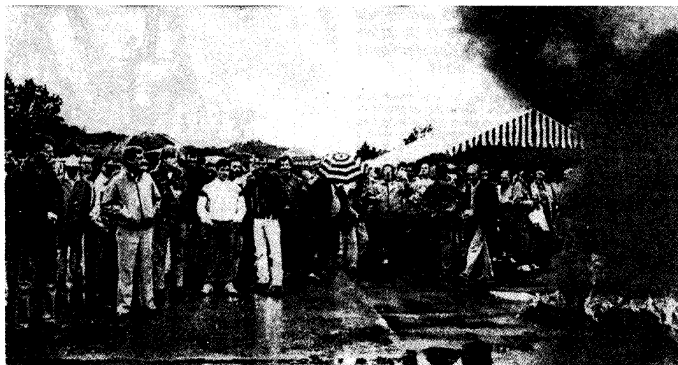
Le piquet de grève de l'entrée principale.

A chaque fois qu'un « sanctionnable » est convoqué au bâtiment X (le bâtiment de la direction), il est accompagné par quelques centaines de grévistes en délégation. Au cours d'un de ces rassemblements devant le bâtiment X, un élu CGT, décrivant la personnalité des cinq « sanctionnables » convoqués ce jour-là - élus CGT, militants, grévistes non syndiqués -